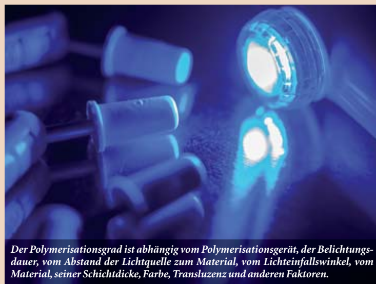
Der Polymerisationsgrad ist abhängig vom Polymerisationsgerät, der Belichtungsdauer, vom Abstand der Lichtquelle zum Material, vom Lichteinfallswinkel, vom Material, seiner Schichtdicke, Farbe, Transluzenz und anderen Faktoren.

Je nach individueller Prädisposition und Immunstatus können Komposite anscheinend zu sehr unterschiedlichen Symptomatiken beitragen bzw. führen – ähnlich einer Virusinfektion, auf die verschiedene Menschen ebenfalls mit sehr unterschiedlichen Symptomen und Verläufen reagieren können. Im Gegensatz zur Virusinfektion, die wir unter Umständen sehr adäquat z.B. durch Fieber selbst erfolgreich therapieren können, verursacht das dauerhaft inkorporierte Komposit permanenten, untherapierbaren Stress an derselben Stelle im Organismus – meist über Jahrzehnte.